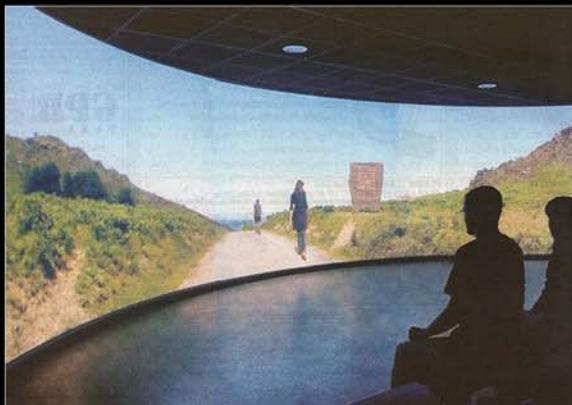
■ Musée Ainocha, Pyrénées Atlantiques.

Musée de la fondation Mérieux. Spectacle sur 360° (soft edge) sur les 4 murs de la salle. Chaque mur fait 8 mètres de base. 8 vidéo-projecteurs (2 par mur) gérés par PCs.