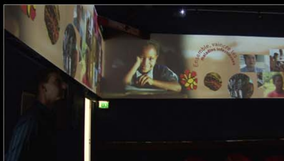
■ Musée Mérieux, Lyon, France.

Réalisation : Studio K - Installation : Telegil et Tabey Ingénierie.