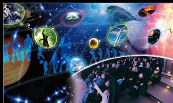
■ Intérieur planétarium

Wings Platinum permet aux concepteurs de concevoir et de réaliser entièrement les diverses séquences qui composeront leurs propres séances. Mais l'intérêt est surtout porté sur les fonctions de 'Show Control' de Wings Platinum : elles permettent, via son 'Panneau de Gestion' et ses boutons interactifs, d'automatiser les séances et de piloter en parfait synchronisme les équipements installés (en DMX, 0-10V, Contacts Secs, RS232, LAN TCP/IP). Ainsi n'importe quel animateur peut, sans risque d'erreur, gérer sa séance en toute liberté d'esprit. S'il désire quitter son pupitre et s'installer parmi les spectateurs, un simple PDA en WIFI lui sert de télécommande et lui affiche les boutons des pages du 'Panneau de Gestion'.