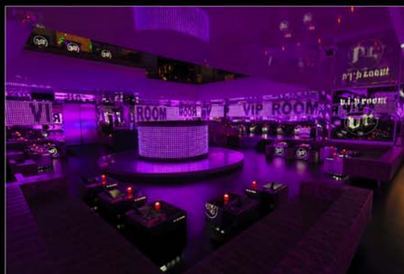
■ VIP Room, Paris.

Réalisation et Installation SIMDA 5V et AVAS.