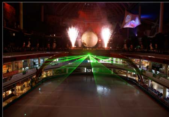
■ Lotte Park, Séoul, Corée du Sud.