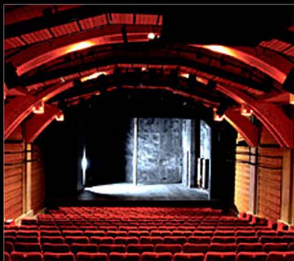
■ Théâtre du Vieux Colombier, Paris.

Installation des vidéo projecteurs, mise en place du logiciel Wings Platinum avec deux licences multi-affichages. Projection panoramique sur écran courbe de 7 mètres.