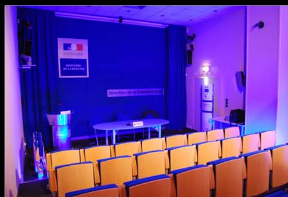
■ DICOD, Ecole Militaire, Paris.

Réalisation et Installation AG3D et AVAS.