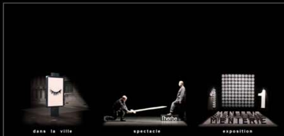
■ La Coupure, spectacle de Pierre Fourny, Alis.