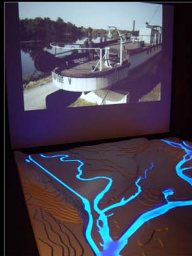
■ Touage de Decize, Nièvre, France.