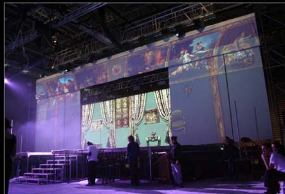
■ Hello Goodbye, spectacle de Candeloro.

Création et réalisation : Pierre Fourny, Compagnie ALIS.