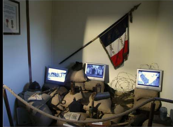
■ Musée du Père Brottier, La Ferté St Cyr, Loiret, France.

1 vidéoprojecteur projette sur une maquette (blanche avec relief géographique de la région) des vues d'avions et des images de synthèse (pour les périodes anciennes) et un autre vidéoprojecteur projette sur un écran à l'arrière des renseignements et des images additionnelles. Les deux vidéo-projections sont parfaitement synchrones.